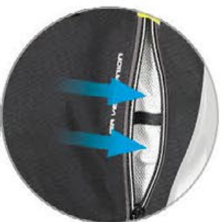
großflächiges Belüftungssystem im Brustbereich, Entlüftung am Rücken

3 JAHRE GARANTIE AUF ALLE BÜSE® PRODUKTE