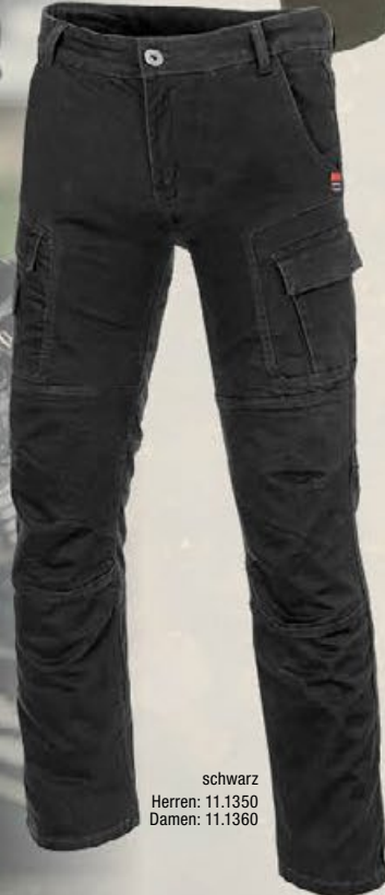
schwarz Herren: 11.1350 Damen: 11.1360