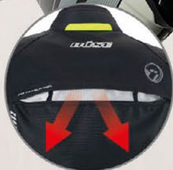
Entlüftung am Rücken