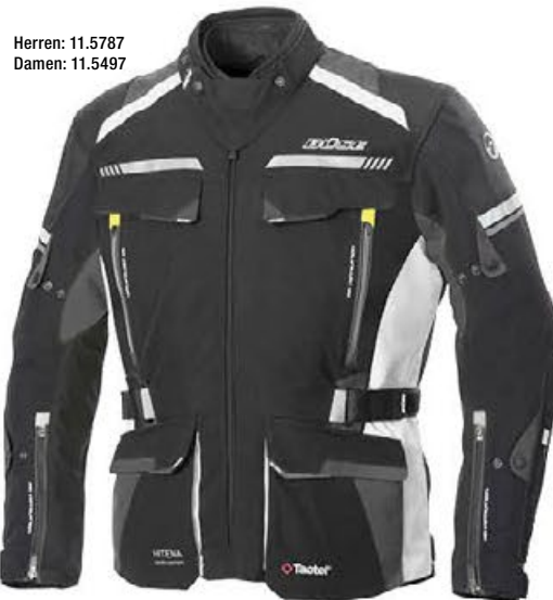
Herren: 11.5787 Damen: 11.5497