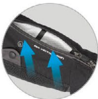
Belüftungssystem mit 2-Wege-Reißverschluss an den Ärmeln