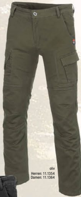
oliv Herren: 11.1354 Damen: 11.1364