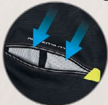
Belüftung an der Front